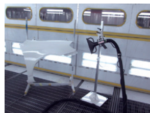
移動式熱風発生器 QUICK-D AQUA III (気高電機社)