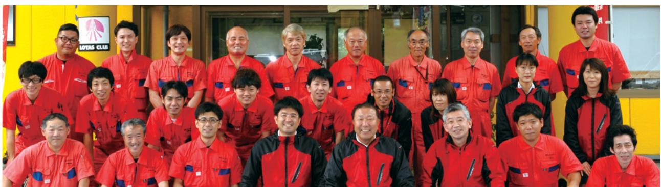
有限会社 大山ボデーの皆さん